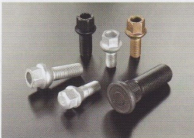
Изделия Fontana Group