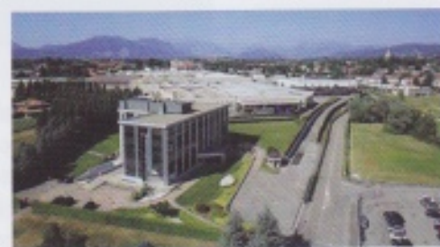
Офисное здание и завод в Ведуджио

всей своей жизни он всегда имел очень сильную связь со своей малой родиной — Brianza, где он родился и где вырос как человек и предприниматель».