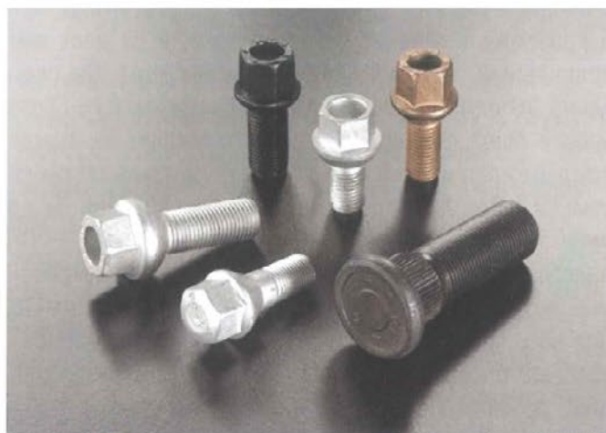
Изделия Fontana Group