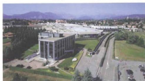
Офисное здание и завод в Ведуджио