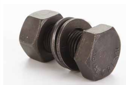
2. In classe K2, Tecnosix ® HR diventa l'elemento di assemblaggio affidabile per le strutture metalliche